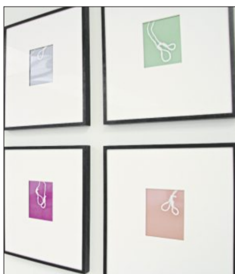
Stricke erinnern an das Schicksal der Urgroßeltern am Ende des Zweiten Weltkriegs.