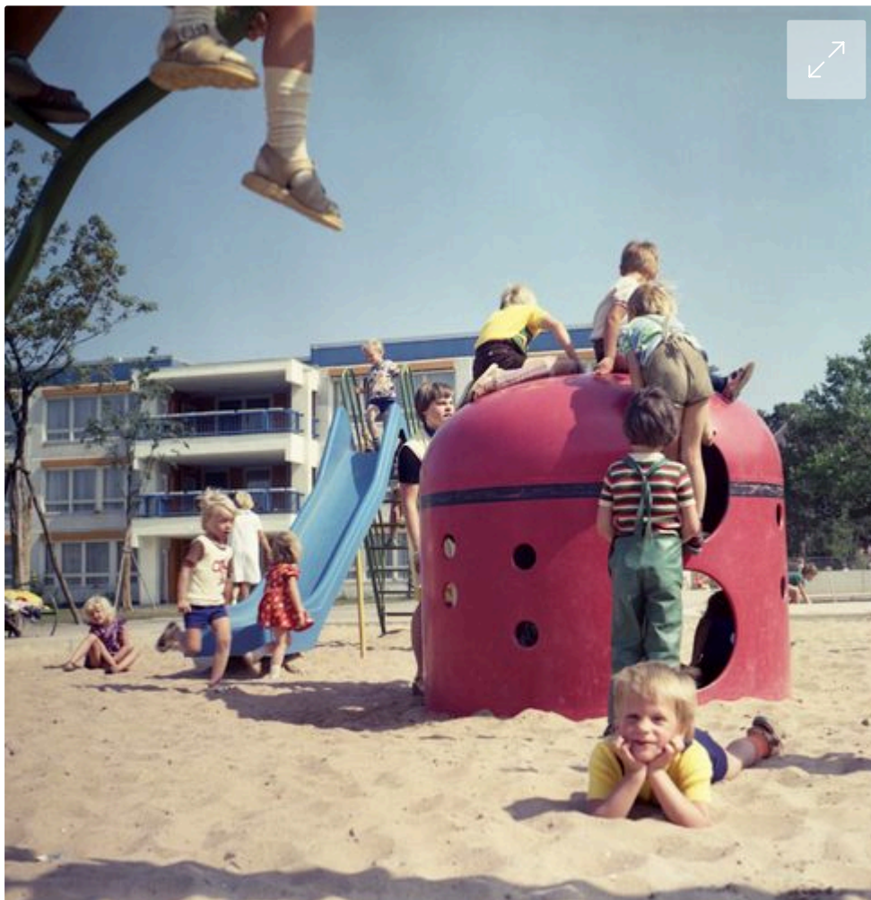
Spielplatz im Rostock der Siebzigerjahre: Drang zum Drill?

Sein neues, um eigene und fremde Fotografien ergänztes Ausstellungsexperiment eröffnet er bewusst am 6. Juni und damit am 80. Jahrestag des rettenden D-Day. So stellt er auf seine Weise die Frage, ob das nicht ein Tag ist, den man auch hierzulande stärker feiern sollte. Denn wie sähe Europa ohne diese »Operation« der Alliierten heute aus?