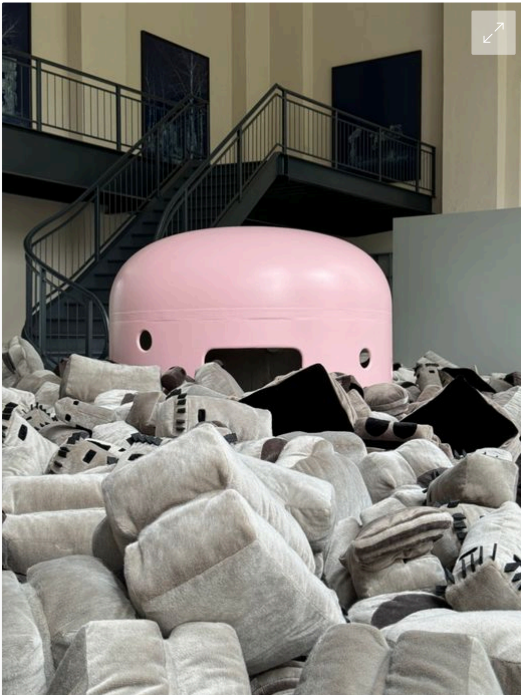
Ausstellungsraum im ehemaligen Breker-Atelier